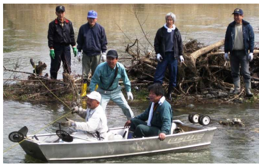
数時間後、作業は終了。全員が順番に引き揚げる様

上昇で川の状況は一変。いったんは中止も覚悟したが、倉掛自治連合会役員は「生い茂る草木を何とかしたい」と、ボートを持ち出して中州へ渡った。