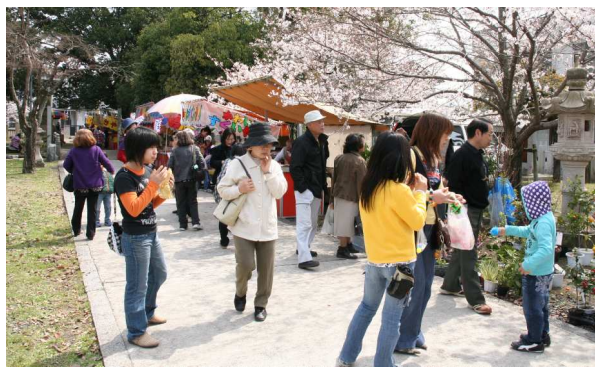
かつての賑わいを期待する声が高まる郷社まつり

この日は郷社まつりのほか、桜橋公園で井原桜まつり、井原駅周辺で産業まつりや得得市が行われ、それぞれ賑わった。