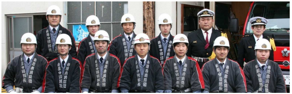
写真左＝平成二十年一月二十日、機庫前で

その後、第3部は分団及び市団の出初式に臨み、午後から市中パレードに参加。向町河原で一斉放水を披露して新年の門出を祝った。