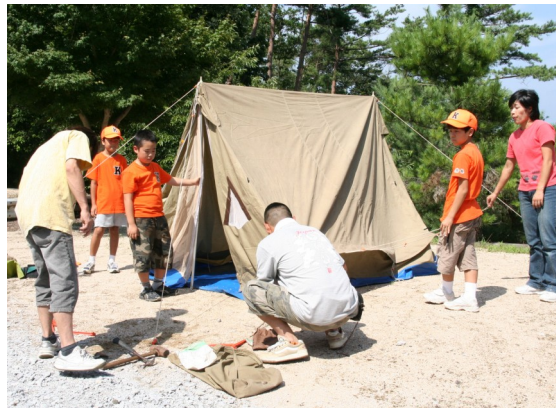
キャンプの初仕事は大小14のテント張り