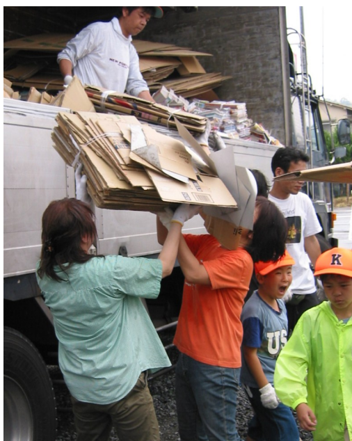
少年団員と作業を行うボランティア＝6月6日