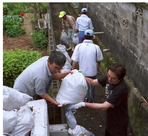
道路に面していないため、中電工駐車を借りての除去作業となった

倉掛のブティックノンから東に延びる排水路に土砂が堆積し、雑草に覆われている問題を解決しようと倉掛のボランティアが立ち上がった。 この排水路はかつて、上流からの水量も多かったことから、付近の地権者が土地を提供し、1・5m幅に広げられた経緯がある。現在、水の流れば変更されて 周辺の雨水が流れ込む程度となつている。 溝掃除は五月三十日に七人のボランティアがスコップを手に集結。一部、建設機械を使ってダンプカーに