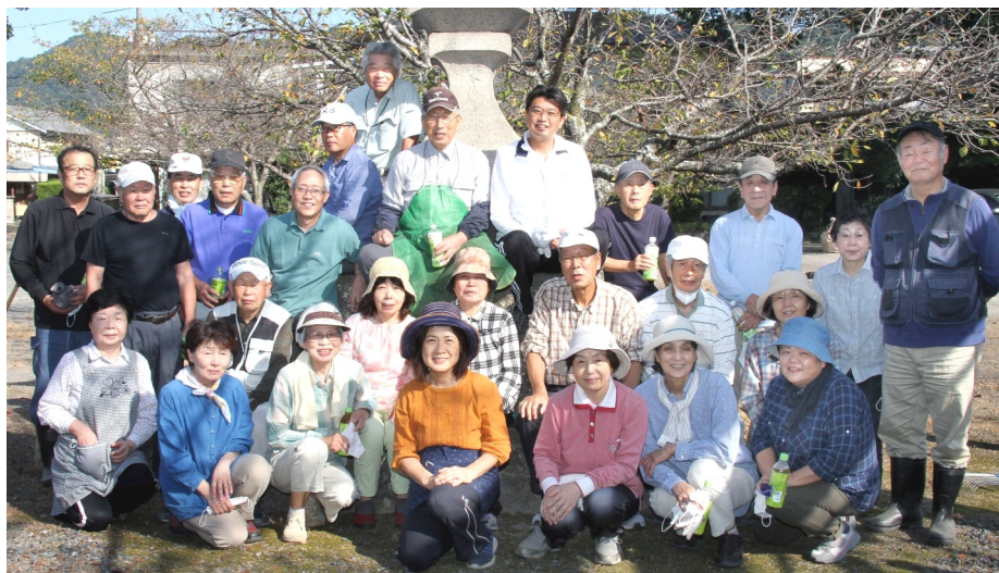
神苑の清掃はほぼ毎月第一日曜日に行われている

10月の郷社足次山神社は定例清掃と井原町秋季大祭一週間前の一斉清掃及び祭典準備に追われた。 3日は強風による大量の落ち葉で作業は難航した