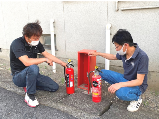
消火器は薬剤の有効期限、消火栓用ホースは経年劣化のチェックが欠かせない

楽しかったひと時を胸に刻み一日目の日程を終えた。二日目はラジオ体操後に朝食をとり、テントを撤収。同9時から三色の顔料