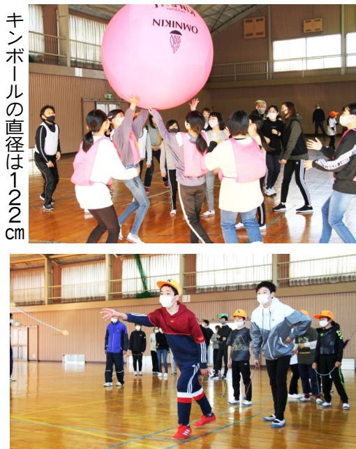
キンボールの直径は122cm ラダーゲッターと呼ばれるスポーツ

郷社足次山神社で1月30日午前9時より、厄除け及び歳祝い祈願祭が執り行われた。 午前10時ごろには、倉掛の70代男性が喜寿の歳の歳祝いに、続いて親子4人連れ=写真=が厄除けに訪れ、山室晶史宮司によるお祓いを受け、木札やお守りを授かった。