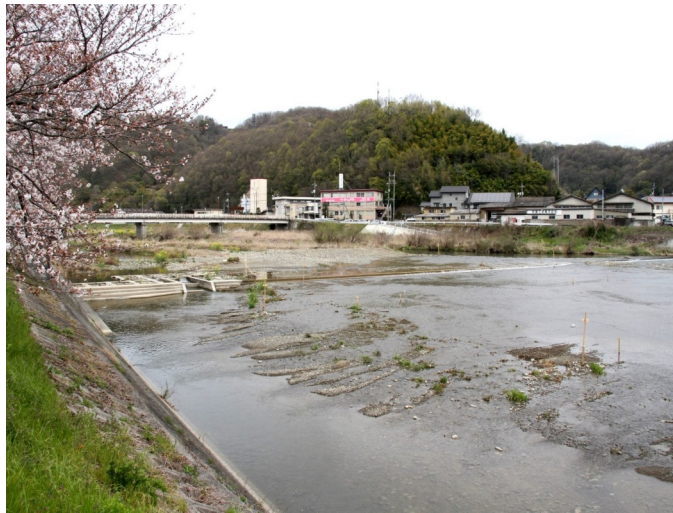
雑木の取り除きから川床掘削工事に至った小田川

2月から3月にかけて行われた小田川河川敷の雑木撤去及び堆積した土砂を取り除く掘削工事が3月末