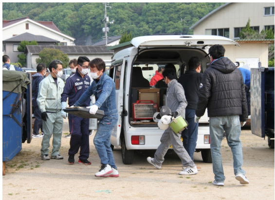
平成15年から始まった不燃性粗大ごみの回収は、今や住民への大切な行政サービス