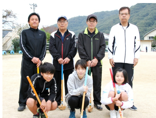
今回も実力を発揮した倉掛チーム