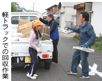
集積所はJA岡山西駐車場