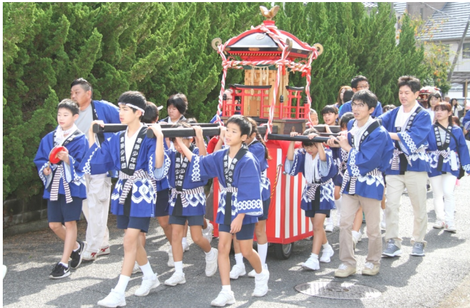
倉掛16組元大西齒科前を通過する倉掛少年団みこし一行