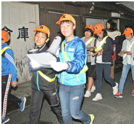
倉掛地内をパトロールしながら防火を呼び掛ける倉掛少年団防火クラブ隊

全国火災予防週間が11月9日から始まり、倉掛少年団防火クラブの夜間パトロール出発式が午後7時からつどえ〜で行われ、関係者約50人が出席した。