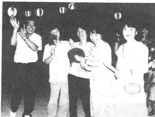
踊りに参加の倉掛婦人会役員

午後七時過ぎ、井原鏡太鼓が勇壮に響き渡る。踊りの曲に乗って人の輪が広がるころ、会場には家族連れの見