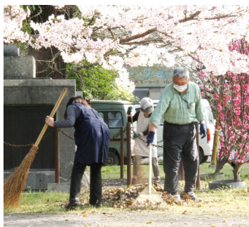
郷社まつり前の一斉清掃

毎月1日に郷社の清掃を 行っている敬神会有志が、 「夏場は草が伸びるのが早 く、いくら取っても焼け石 に水」と、非常事態を宣 言した。