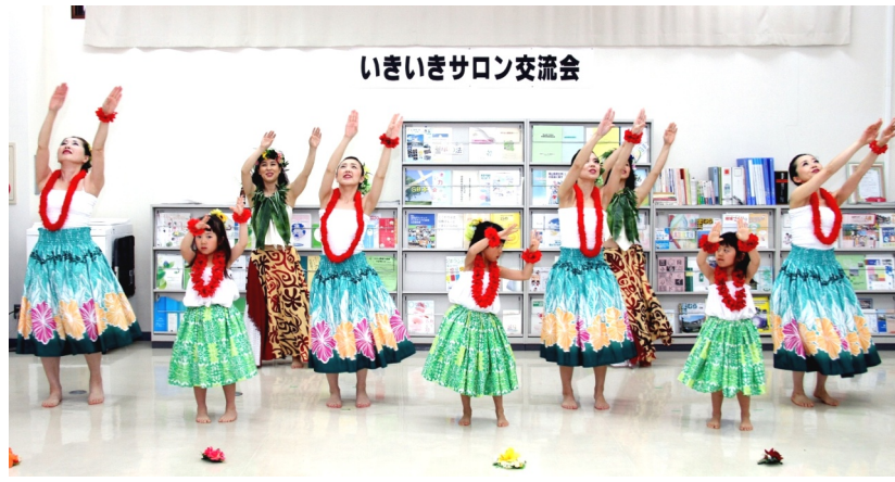
いきいきサロン交流会